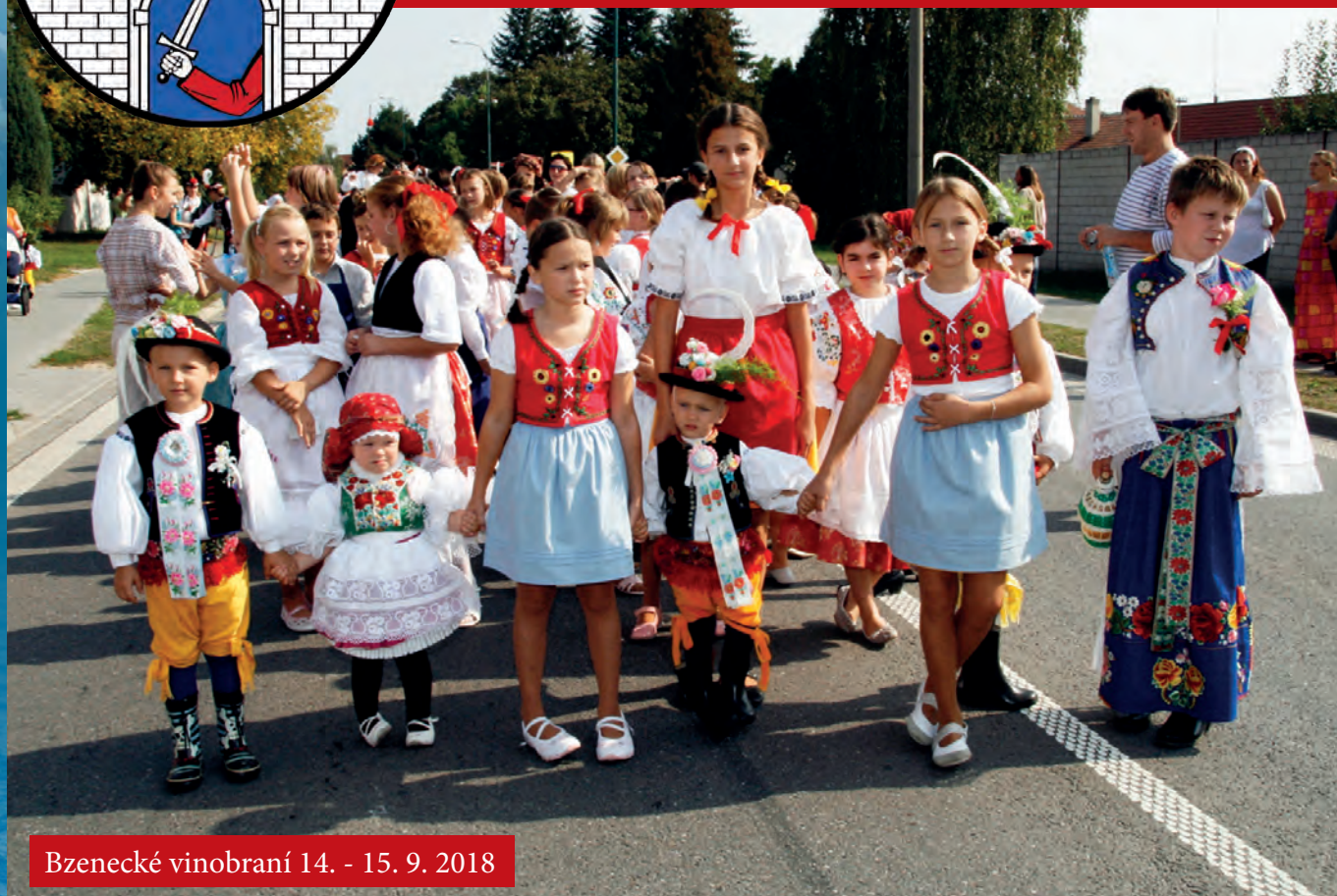
Bzenecké vinobraní 14. - 15. 9. 2018