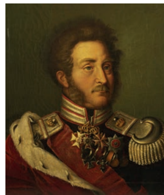
Vilém II. Hesenský (1777–1847). Syn kurfiřta Viléma I. a jeho manželky Karoliny Vilemíny Dánské.

Bzenecký zpravodaj - čtvrtletník, periodický tisk územního samosprávného celku.