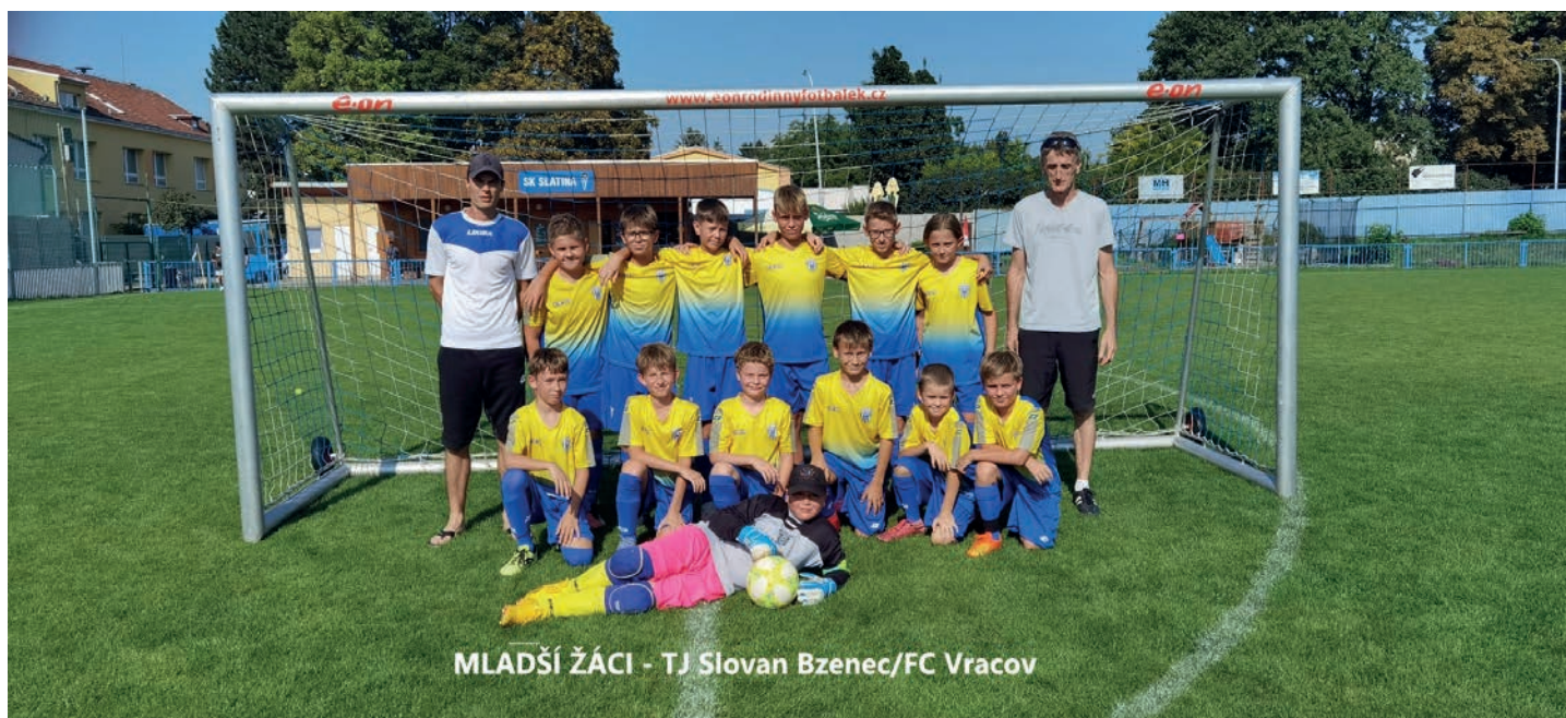
MLADŠÍ ŽÁCI - TJ Slovan Bzenec/FC Vracov