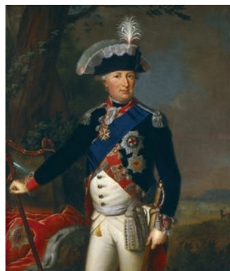
Vilém I. Hesenský (1743–1821). Syn lankraběte Fridricha II. Hesensko-Kasselského a jeho manželky Marie Hannoverké, dcery anglického krále Jiřího II. z hannoverské dynastie.