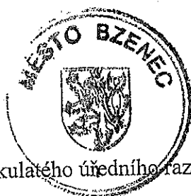
Otisk kulatého úředního razítka