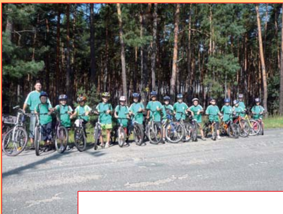
Letní soustředění na Littneru.

Trenéři nejmenších nadějí Slovanu Bzenec P. Hartman a O. Okénka