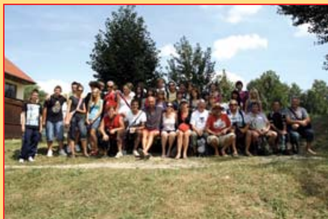
Z výletu u Baťova kanálu.

Čas strašně rychle utíká a už máme poslední den návštěvy. Ráno jsme vyrazili na plavbu lodí po Baťově kanále a řece Moravě, odpoledne nám naši hosté připravili prezentace na téma třídění odpadů a ekologie v jejich zemích. Na večer se děti těšily nejvíc. Zaměstnanci podniku Excalibur připravili pro všechny zúčastněné, tedy i hostitelské rodiny, závěrečnou společnou večeři s diskotékou, která trvala až do půlnoci. Pak už se šlo spát, protože naše hosty čekala brzy ráno dlouhá cesta domů.