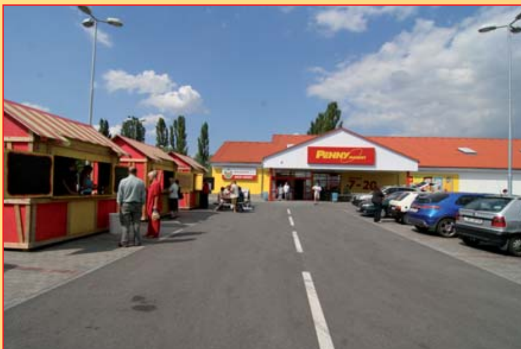
V našem městě bylo otevřeno nové nákupní středisko.