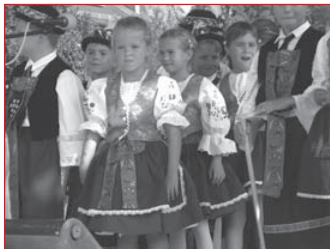
Děti ze základní školy na podiu.