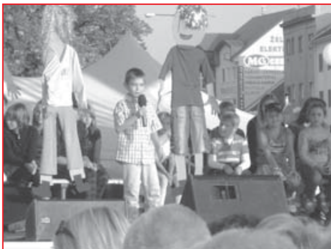
Z letošního Carusoshow.

Podrobnější zprávy a fotografie z krojovaného vinobraní zveřejníme v příštím čísle zpravodaje.