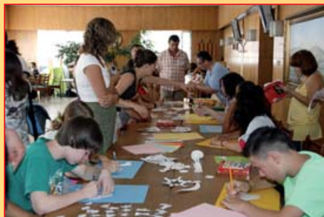
Tvořivá dílna pro děti i dospělé.