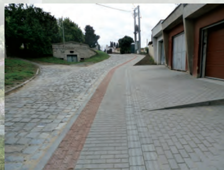
chodník ke hřbitovu po opravě

V roce 2015 město Bzenec pokračovalo ve výstavbě a opravě místních komunikací, veřejného osvětlení, opravě chodníků a revitalizačních ploch v ulicích města. V tomto roce byla rovněž provedena výměna oken a zateplení fasády v mateřské škole.