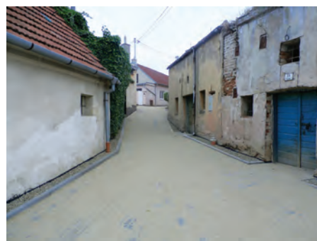
ulice Karla Čapka po rekonstrukci