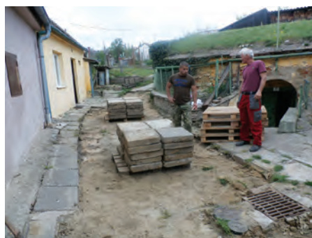
ulice Karla Čapka před rekonstrukcí