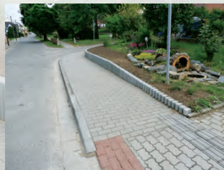
chodník ke hřbitovu po opravě