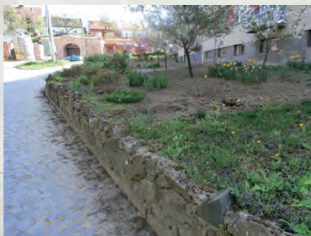
chodník ke hřbitovu před opravou