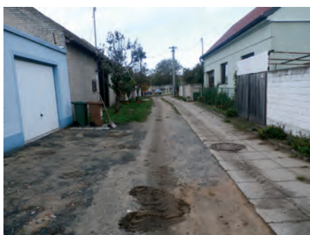
ulice Kollárova před rekonstrukcí