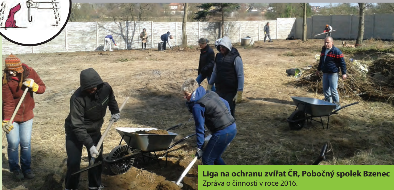
Liga na ochranu zvířat ČR, Pobočný spolek Bzenec Zpráva o činnosti v roce 2016.