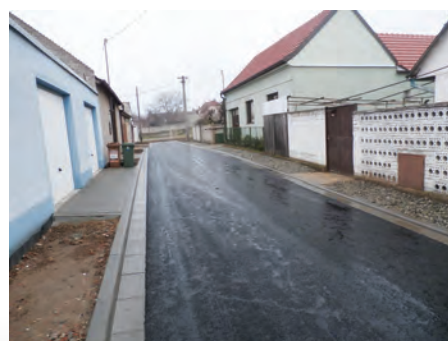
ulice Kollárova po rekonstrukci