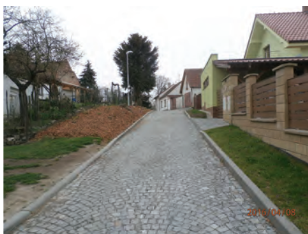
ulice Žerotínova po rekonstrukci