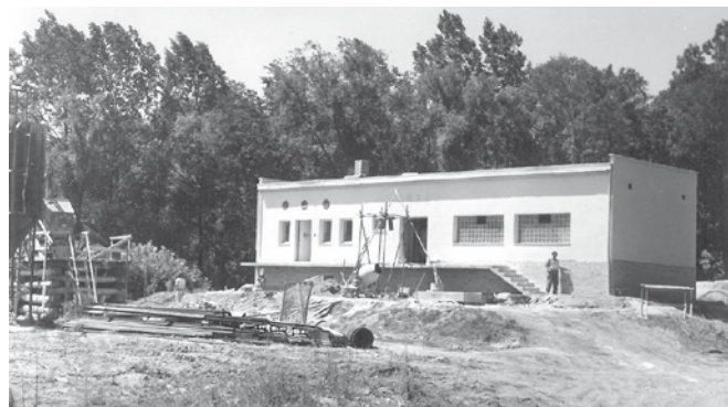
Jímací území Bzenec, výstavba stanice 1 Moravský Písek v roce 1975.