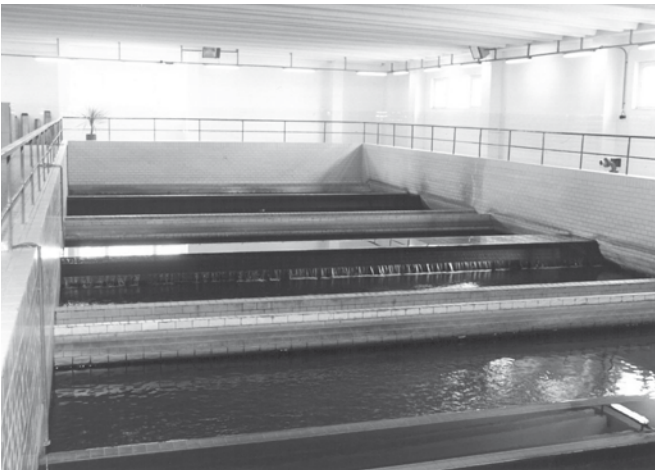
Úpravna vody Bzenec - Přívoz 1994, hala pískových filtrů.