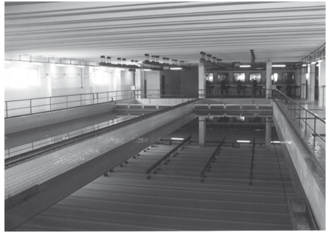
Areál úpravy vody Bzenec - Přívoz v roce 1994, sedimentační nádrže.