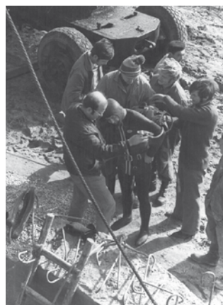
Jímací území Bzenec, výstavba sběrné studny v 70. letech 20. století.