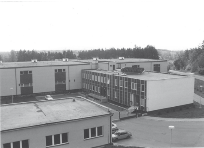
Areál úpravy vody Bzenec - Přívoz v roce 1994.