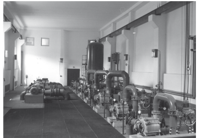
Úpravna vody Bzenec - Přívoz 1994, strojovna pro čerpání pitné vody na vodojemy Vracov, Bzenec a Dražky.