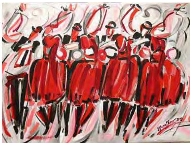
Kyjovská skočná (olej). Autor: DENÍK/Miroslav Potyka