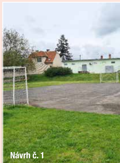
Návrh č. 1