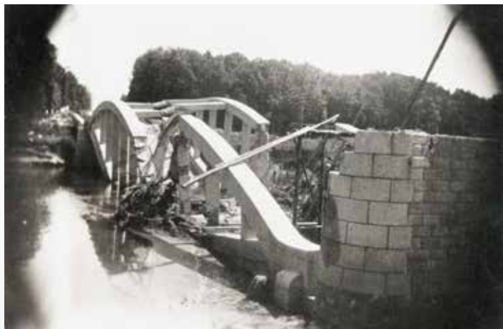
Zničený most v dubnu 1945.

Dne 4. 4. 1938 proběhla kolaudace mostu a slavnostní otevření bylo naplánováno na 26. května téhož roku. Částečná mobilizace a celková mezinárodní situace však odložila tento slavnostní akt na neurčito a most byl zprovozněn. Sloužil však jen do dubna 1945, kdy jej zničila ustupující německá vojska. Sovětští ženisté za pomoci okolních obyvatel vybuodovali prozatímní dřevěné přemostění řeky Moravy, které však bylo v provozu ještě mnoho let