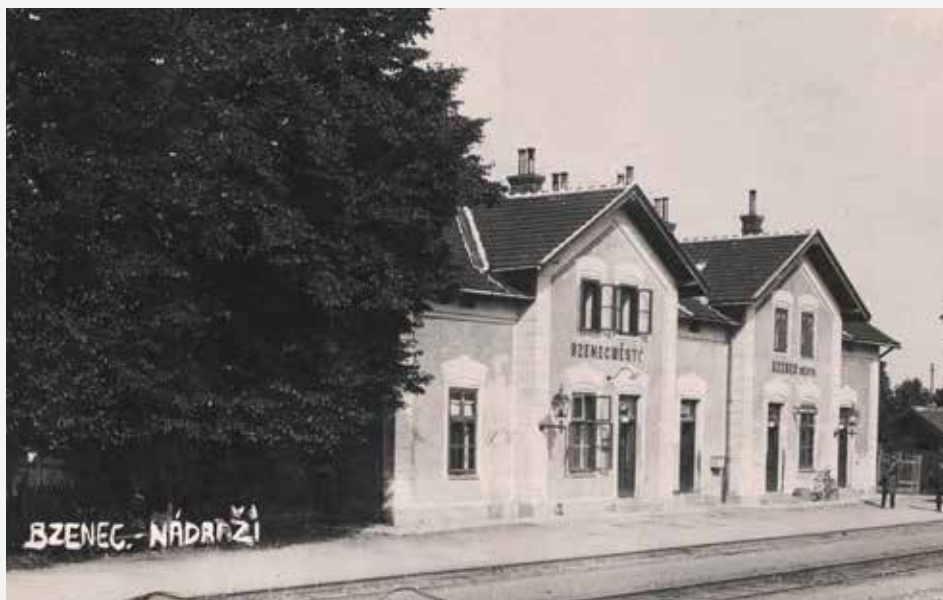
Dobová pohlednice zachycující bzenecké nádraží za první republiky.