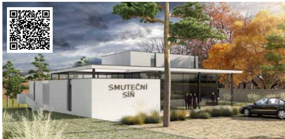
Smuteční síň – ilustrativní obrázek, Město Miroslav, studie z roku 2017, IS-ARCH S.R.O.

V současné době je však nalezení vhodné lokality pro stavbu smuteční síně složité. Vytipoval jsem proto čtyři možné lokality, které by za určitých podmínek mohly být zváženy, a zároveň vás prosím, abyste přidali vlastní návrhy nebo komentáře.