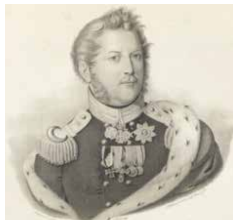
Kurfiřt Vilém II. Hesenský.

Petr Janovský, Libor Kuchař, Vít Vratislavský