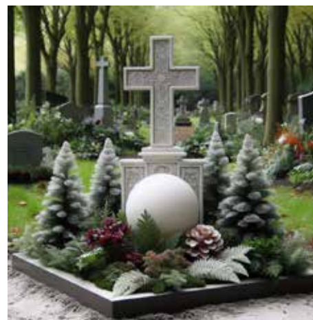
Pietní místo – ilustrativní obrázek