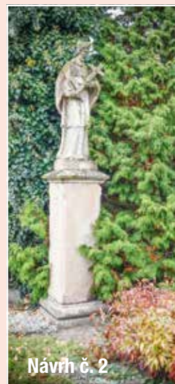
Návrh č. 2