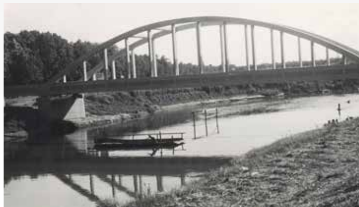
Snímek přívozní pramice spolu s dokončeným mostem Dr. Edvarda Beneše na snímku z konce 30. let 20. století.

Dne 13. 11. 1931 Zastupitelstvo města Bzenec vyčlenilo příspěvek 120 000 Kč na regulaci řeky v prostoru zamýšlené stavby a 170 000 Kč na samotnou stavbu. V roce 1934 byla zadána stavba pilířů firmě Kaulich z Ostravy s podmínkou, že pilíře budou zhotoveny do poloviny roku 1935. Při jejich budování byly nalezeny pozůstatky dřevěných pilířů mostu, který zde stával před třicetiletou válkou, ale zřejmě ještě v průběhu 17. století zanikl. Dne 5. 6. 1937 se Zastupitelstvo města Bzence a Strážnice jednomyslně usneslo pojmenovat most jménem prezidenta Dr. Edvarda Beneše.