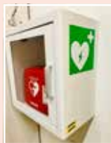
Návrh č. 4