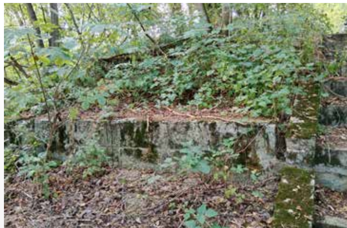
I v současnosti jsou na břehu stále vidět pozůstatky původního mostu (zdroj: Bc. Vojtěch Bača).