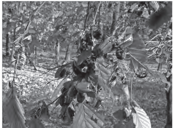
Chrousti na porostu habru