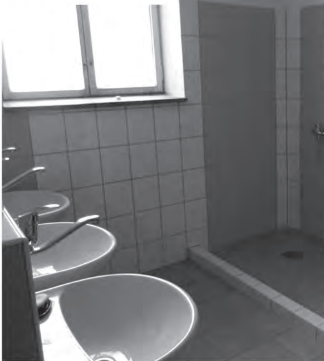
REKONSTRUKCE SOC. ZAŘÍZENÍ V KASÁRNÁCH