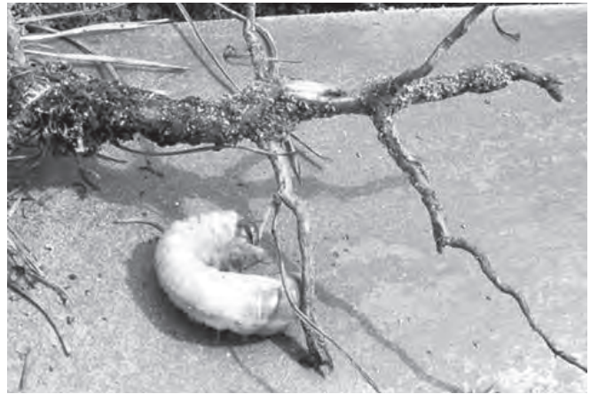
Ponrava – larva chrousta