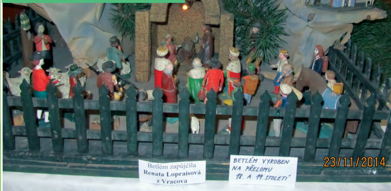
Betlém zapůjčila Renata Lopraisová z Vracova