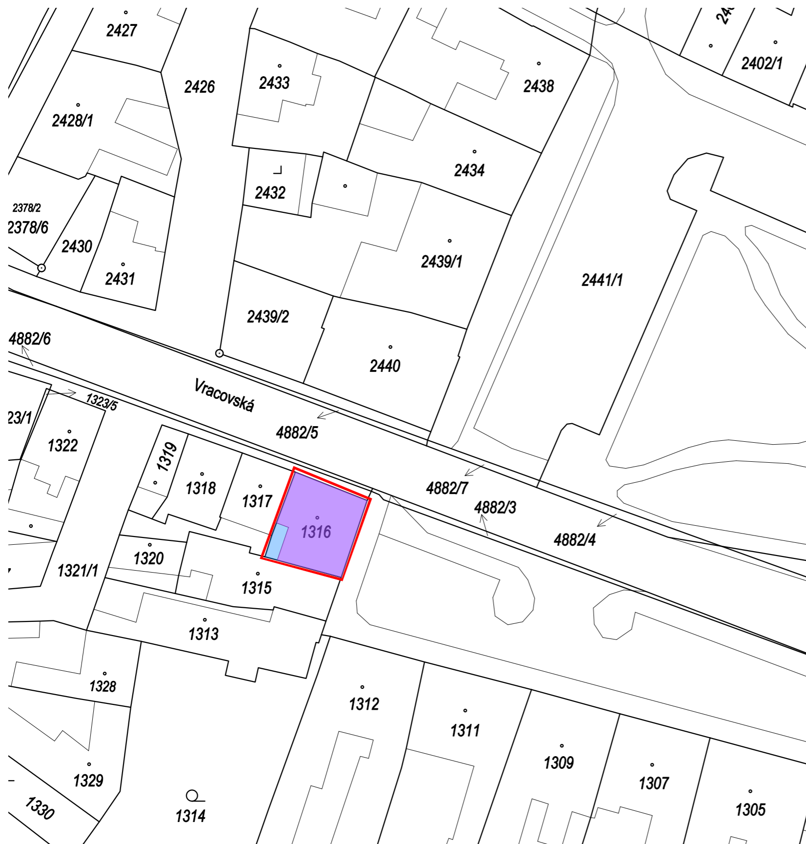
SITUACE KATASTRÁLNÍ MAPA.