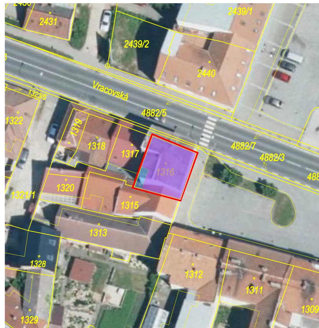
SITUACE ORTO FOTO MAPA.

p.č. 1316 v k. ú. Bzenec, budova s číslem popisným - č. p. 805, rodinný dům, druh pozemku - zastavěná plocha a nádvoří, vlastnické právo - Město Bzenec, náměstí Svobody 73, 696 81 Bzenec