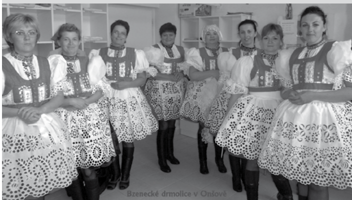
Bzenecké drmolice v Onšově