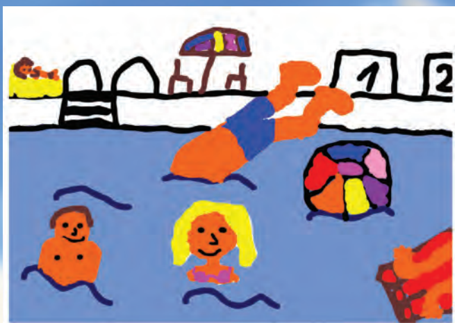
Foto: práce žáků počítačové grafiky