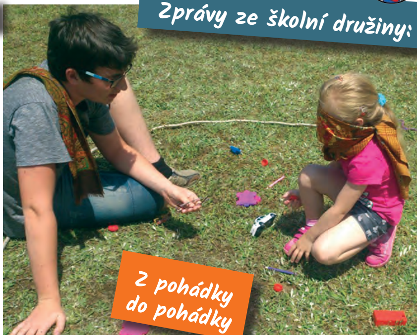
Zprávy ze školní družiny: