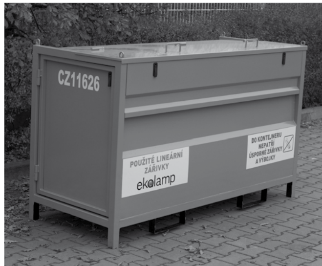
Foto typu kontejneru, který je umístěn ve sběrném dvoře.

Více se o problematice nakládání s nefunkčními zářivkami dočtete na www.ekolamp.cz .