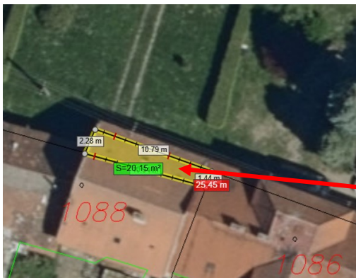
Snímek č. 1