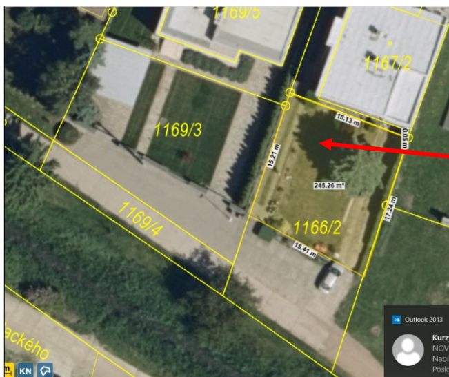
Snímek č. 2

Převáděná část pozemku parcel. č.: 1100/1 - díl označen žlutou barvou – cca 20 m 2 . Je zastavěn stavbou RD č.p. 240 v ul. Olšovská.