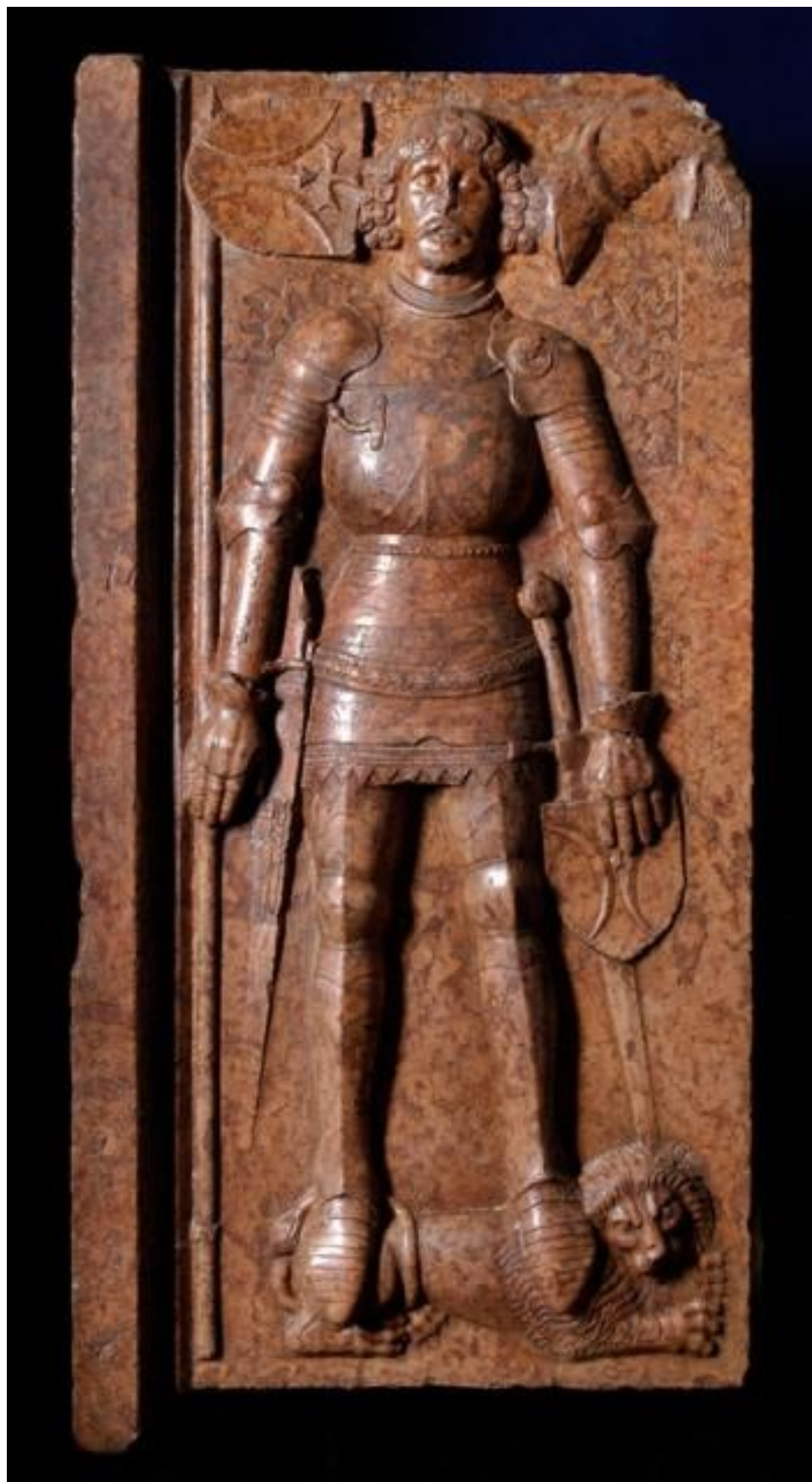
obr. 1 – Náhrobní kámen Stibora II. ze Stibořic, držitele bzeneckého panství mezi lety 1422 – 1434, který je uložen v Historickém muzeu v Budapešti.