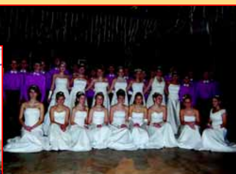
Polonéza žáků základní školy