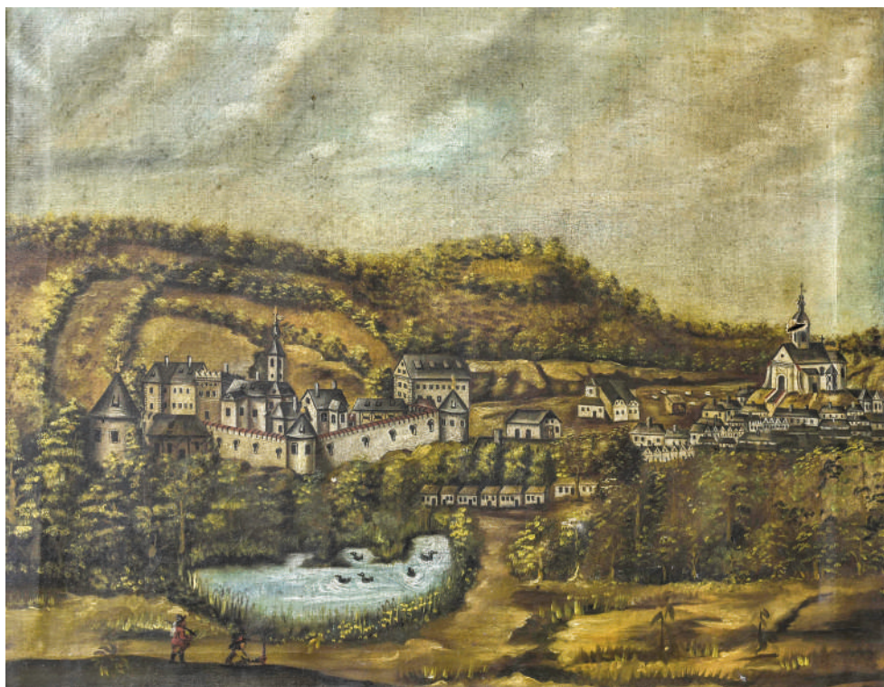
Původní podoba bzeneckého zámku přestavěného z pozdně gotické tvrze na vyobrazení z druhé poloviny 17. století.

Vít Vratislavský, Libor Kuchař a Petr Janovský